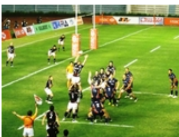
ラグビーのアジア 5 カ国対抗で、フィリピンが UAE を下しトップ 5 に残留 = 18 日、マニラ